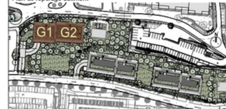
Plan de repérage niveau