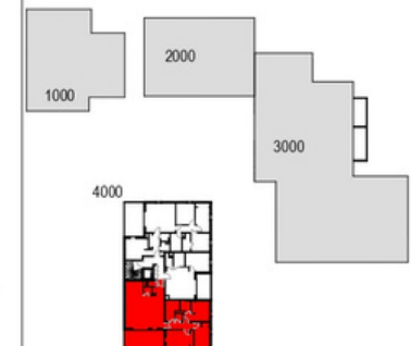
PLAN DE REPERAGE